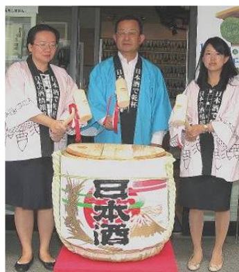
こちらは昼の部の鏡開き