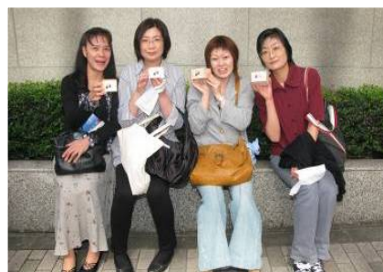
「日本酒、応援してます！」