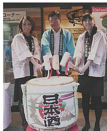
夜の部での鏡開きの模様

10月1日「日本酒の日」を祝う恒例の「ふるまい酒」が、同月3日の正午と夕方5時の2回、日本の酒情報館1階の入り口前で開催されました。昭和53年の制定以来32回目目の「日本酒の日」となりますが、東日本大震災という未曾有の災害に見舞われた今年には、例年以上に格別な1日。会場では、多くの日本酒ファンから「蔵元がんばれ」「日本酒もっと飲みます」といった励ましの言葉が寄せられ、「復興へ、日本酒で乾杯！」の風景を繰り広げました。