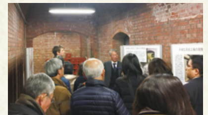
赤煉瓦酒造工場見学の様子