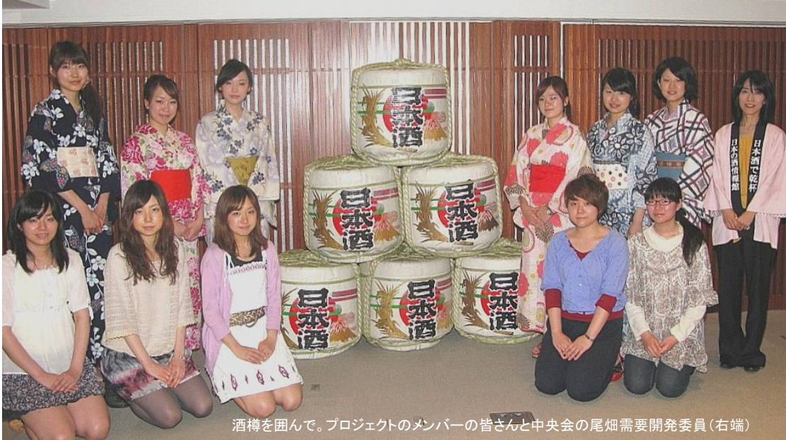
酒樽を囲んで。プロジェクトのメンバーの皆さんと中央会の尾畑需要開発委員(右端)

「日本酒クールスタイル」など、お洒落な飲み方普及へ 若い女性の感性が日本酒をどう彩るか、高まる期待